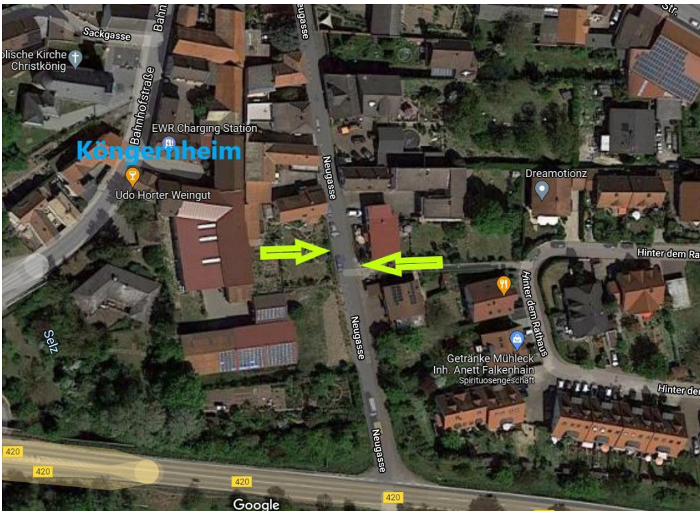
Skizze: Köngernheim Neugasse