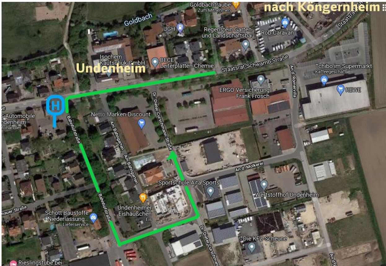
Skizze: Stichfahrt Udenheim